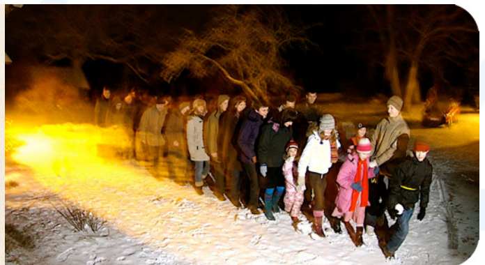
Jõulupalgi lohistamine Austris Grasise majas „Ģenderti”, mis asub Mazsalaca lähedal, 2008.