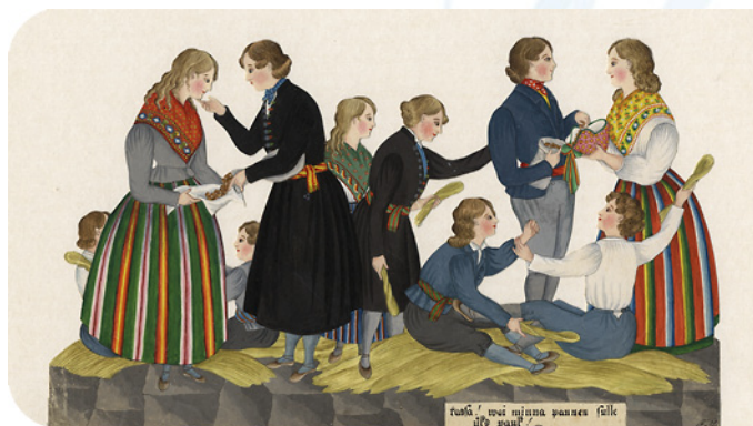
F. v. Uexküll mākslas darbs (19.g.s. sākums), no Igaunijas Nacionālā muzeja arhīviem

No Igaunijas Ārlietu ministrijas, www.vm.ee