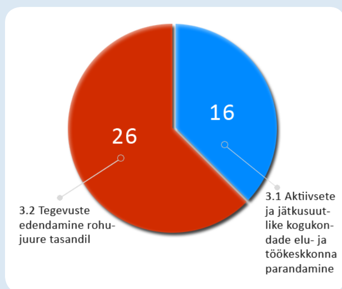
Taotletud toetussummad toetussuuna järgi