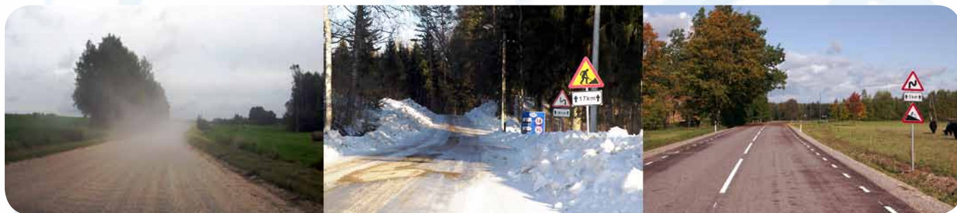
Tee enne rekonstrueerimist

Projekti partnerid olid Maanteeamet (endine Lääne Regionaalne Maanteeamet) ning Läti Transpordiministeerium, mida esindas Läti Riigiteed (riiklik kapitaliühing).